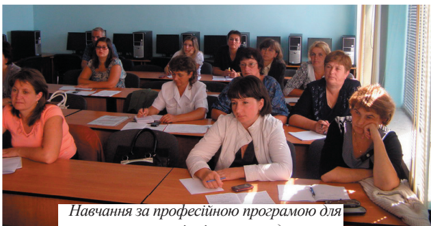
Навчання за професійною програмою для секретарів сільських рад

За програмами короткотермінових семінарів провчилося 251 особа, з них: 117 державних службовців та посадових осіб місцевого самоврядування області з питань запобігання та протидії проявам корупції в органах влади, 106 працівників кадрових служб структурних підрозділів облдержадміністрації, райдержадміністрацій та територіальних управлінь центральних органів влади і 28 працівників Головного управління Пенсійного фонду України в Чернівецькій області.