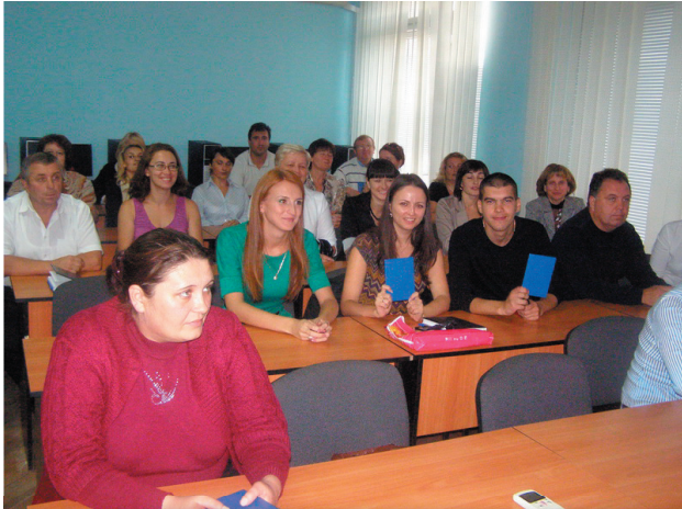
Навчання за Професійною програмою для спеціалістів фінансових управлінь, відділів освіти і відділів культури РДА