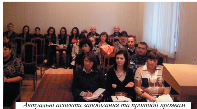
Актуальні аспекти запобігання та протидії проявам корупції в органах державної влади та в органах місцевого самоврядування