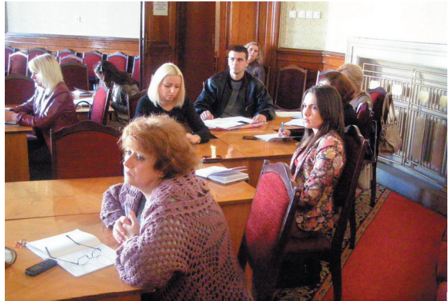
Навчання за програмою постійно діючого семінару «Організація роботи служб персоналу органів державної влади в умовах дії нового законодавства»

Впродовж ІІІ кварталу 2012 року в Центрі підвищило кваліфікацію 296 державних службовців та посадових осіб органів місцевого самоврядування. За Професійною програмою підвищило кваліфікацію 18 секретарів сільських рад та 27 державних службовців фінансових управлінь, відділів освіти, культури райдержадміністрацій, Чернівецької та Новодністровської міських рад.